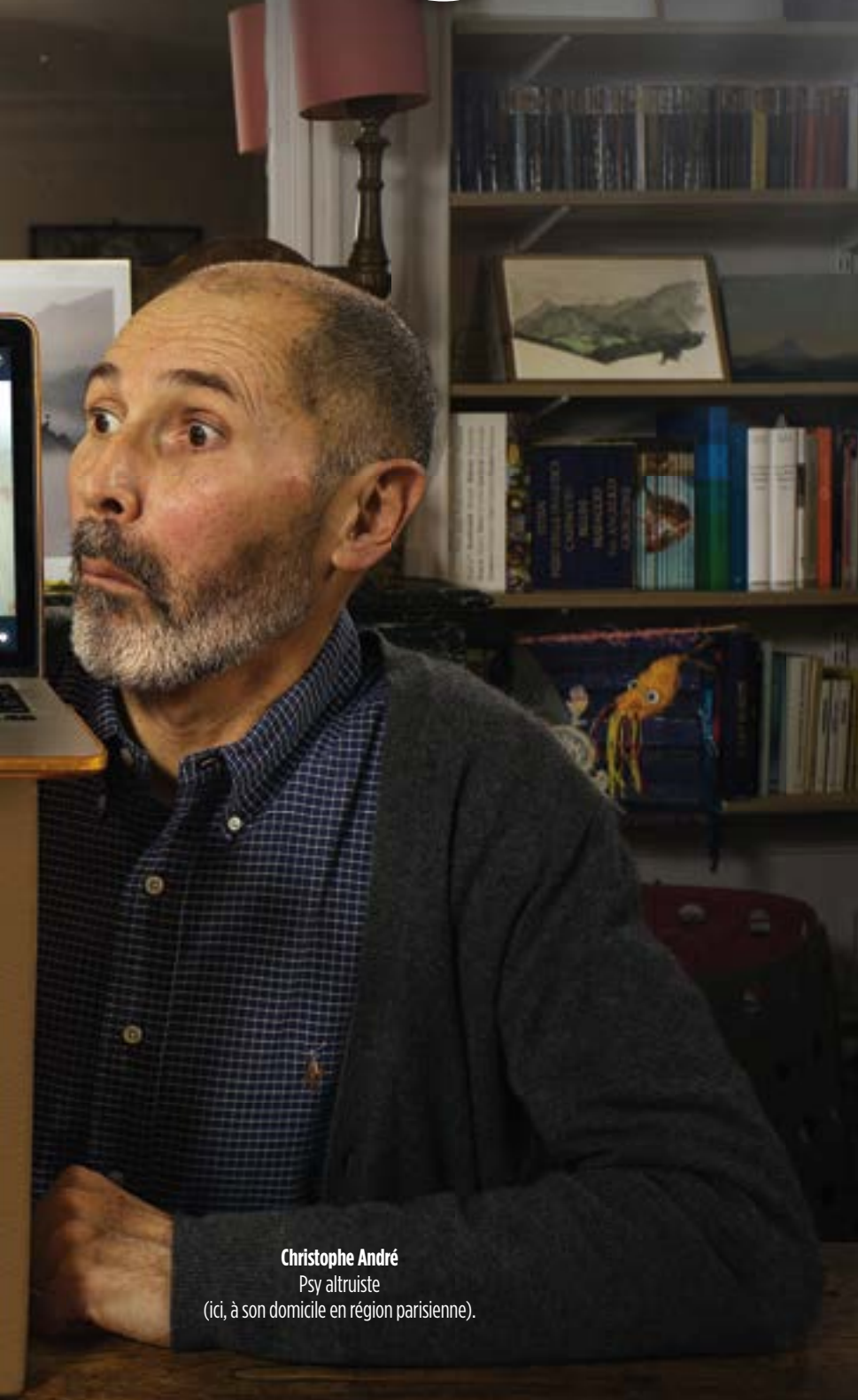
Christophe André Psy altruiste (ici, à son domicile en région parisienne).

Sésame. Matthieu Ricard, Christophe André et Alexandre Jollien publient un guide pour mieux vivre. Leurs méthodes.